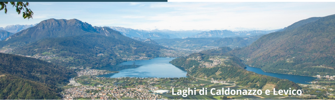
Laghi di Caldronazzo e Levico

Entrambi i laghi sono stati premiati anche nel 2023 con il riconoscimento "Bandiera Blu".